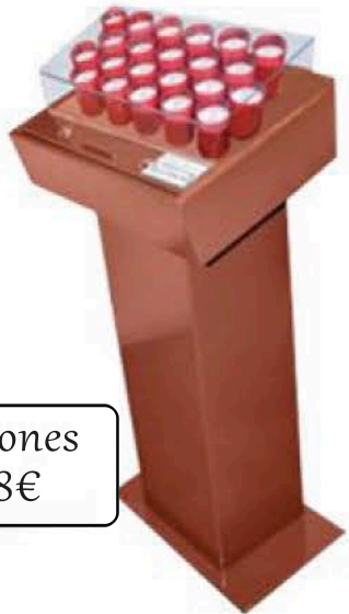
22 velones 1428€