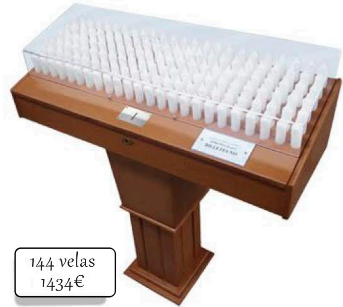
144 velas 1434€