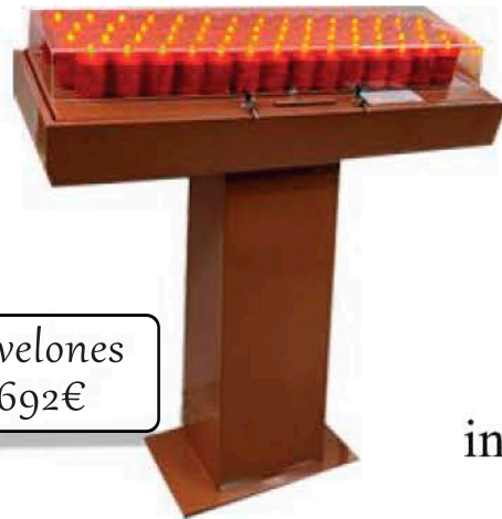
63 velones 1692€