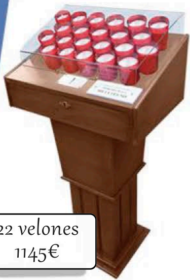
22 velones 1145€