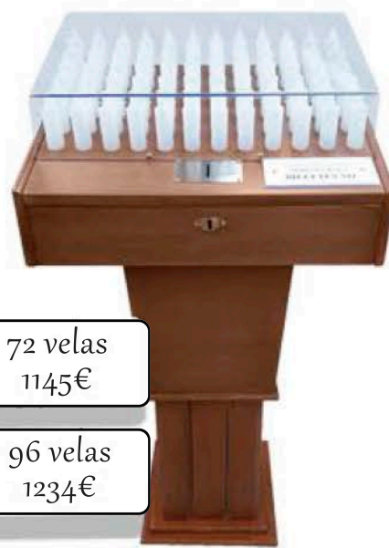
72 velas 1145€