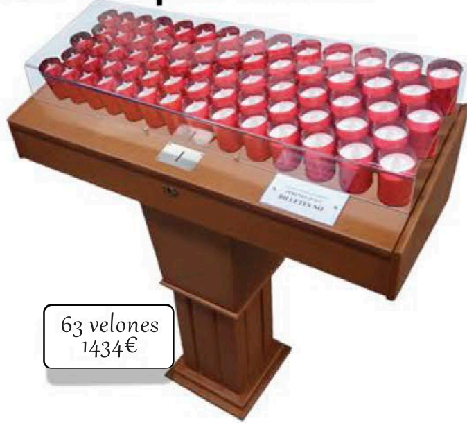
63 velones 1434€